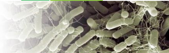
Bacillus amyloliquefaciens souche IT45