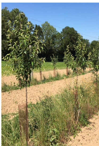
Rise p à 200 gr/ha