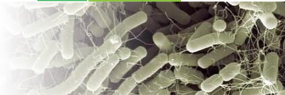
Bacillus amyloliquefaciens souche IT45